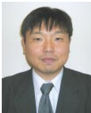
咸 勝規 大阪経済法科大学 入試課

また、2名のうち1名については、関東地方に「身元引受人」的な日本人の知り合いがおり、そちらに一定期間滞在していたということもあって、その方と日本語に