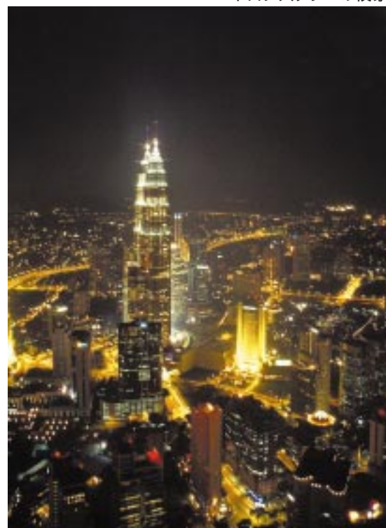
KLタワーから見る ペトロナスタワーの夜景